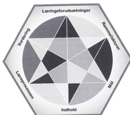
Figur 1 Hiim og HIPPES relations model, s. 73.

I planlægning af en undervisningsgang er det en god idé at benytte sig af Hiim og HIPPES relations model. Modellen går ud på at der er en sammenhæng/relation mellem de forskellige elementer i undervisningen. Ændringer på en faktor, påvirker andre faktorer, måske laver den endda ændringer i en anden faktor osv. På den måde kan man – eller faktorerne selv – lave fuldstændig om på en aktivitet/undervisning (Hiim og Hippe). Modellen er særdeles god